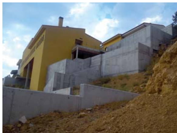
De peldaño en peldaño fugitiva.

Digamos, primero, que las competencias en materia de mayores pertenecen a la Administración de la Junta de Comunidades de Castilla-La Mancha. Así, el Estatuto de Autonomía, de 10 de agosto de 1986, en el artículo 31, punto 1, dice que es competencia de la Junta, entre otras, la señalada con el ordinal núm. 20, y que dice: « Asistencia social y servicios sociales. Promoción y ayuda a los menores, jóvenes, tercera edad, emigrantes, minusválidos y demás grupos sociales necesitados de especial atención, incluida la creación de centros de protección, reinserción y rehabilitación ».