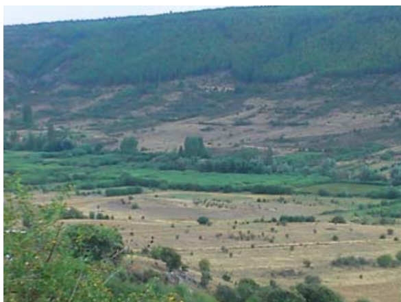
Vega del río Masegar. Entre El Tobar y Beteta.