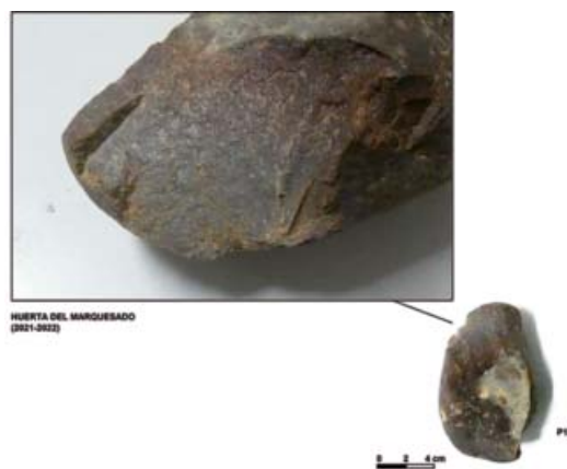
Canto trabajado Modo 1.