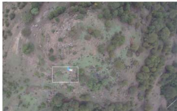
Situación en el Cerrito del Moro.

El hallazgo de un canto trabajado de cuarcita encontrado en las inmediaciones del área de trabajo es evidencia de la actividad humana de esta zona serrana desde el Paleolítico Inferior.