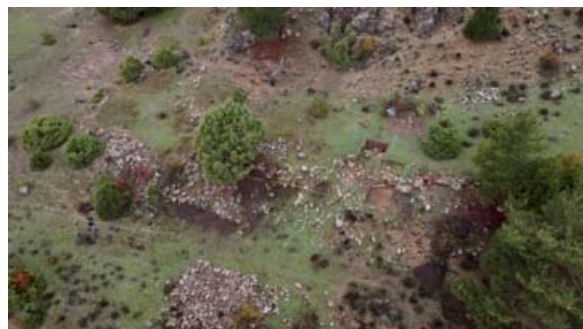
Vista general de Cerrito del Moro. Detalle.