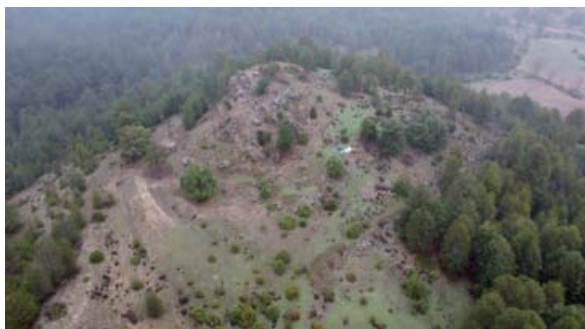
Vista general de Cerrito del Moro.

En la intervención de 2021 en el Cerrito del Moro se prospectó el castro y sus alrededores inmediatos, identificando y topografiando sus principales estructuras visibles en superficie. Después se ejecutó un primer sondeo arqueológico para la comprobación de la potencia arqueológica conservada en uno de los aterrazamientos en los que se estructuraba la población. Se recuperaron grandes cantidades de materiales arqueológicos. Los resultados de los trabajos de esa primera campaña están en proceso de publicación.