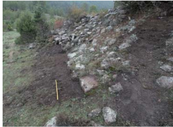
Estructuras excavadas en 2022.

En tercer lugar queremos destacar la presencia de materiales medievales (islámicos y posiblemente anteriores) localizados en estratos en los que se aprecia una distribución estratigráfica desordenada. Al no haberse excavado suficiente extensión de suelo, no se puede valorar la intensidad de la reocupación del castro en época histórica. Sí se debe apuntar a que varios yacimientos que personalmente hemos excavado (y que estamos estudiando en el presente) demuestran un patrón de ocupación similar: origen en la Protohistoria, su abandono en época romana y su reocupación en la Edad Media anterior a la reconquista. Es el caso, por ejemplo, del Castro de Noheda, los dos castillejos de Masegosa y la Hoya del Villar en Villanueva de Alcorón, Guadalajara.