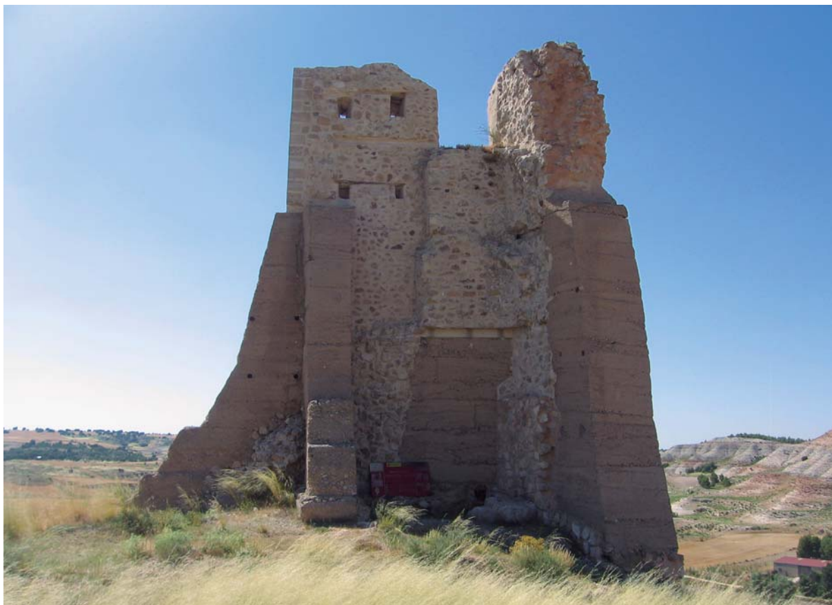
Ruinas del Castillo de Torralba.